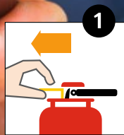
1 Sicherung entfernen