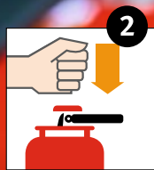
2 Schlagknopf betätigen